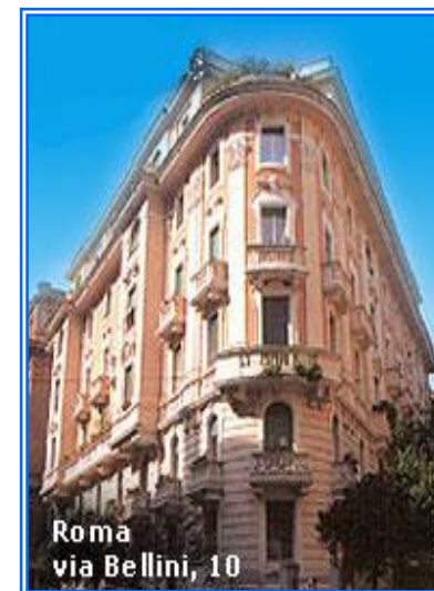
La nostra sede